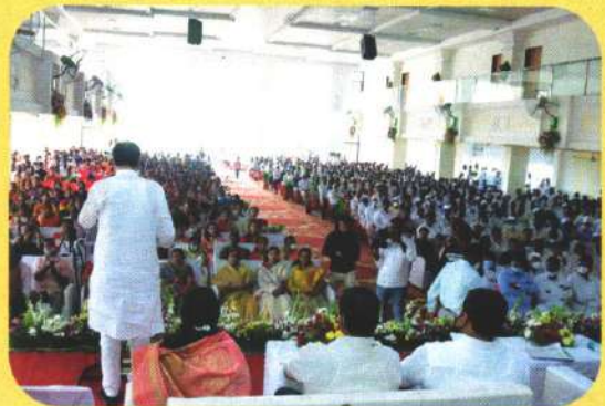
सभासद मेळाव्या प्रसंगी उपस्थित सभासद व महिला यांना मार्गदर्शन करताना मा.ना. मा.ना.अजितदादा पवार मा.उपमुख्यमंत्री व विद्यमान विरोधी पक्ष नेते महाराष्ट्र राज्य