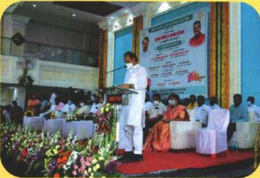
सभासद मेळाव्या प्रसंगी सभासदांना मार्गदर्शन करताना मा.ना.अजितदादा पवार मा.उपमुख्यमंत्री व विद्यमान विरोधी पक्ष नेते महाराष्ट्र राज्य