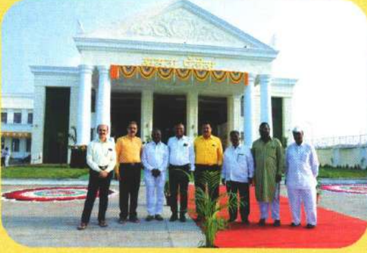
संस्थेने सभासदासाठी बांधलेला हॉल व संस्थेचे संचालक मंडळ