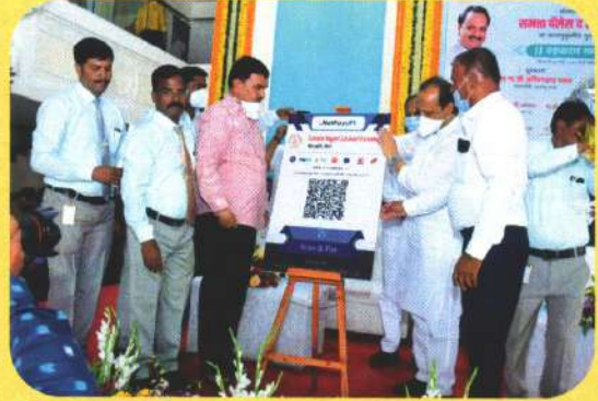
संस्थेच्या सभासदासाठी क्यू. आर.कोडचे उद्घाटन करताना मा.अजितदादा पवार मा.उपमुख्यमंत्री व विद्यमान विरोधी पक्ष नेते महाराष्ट्र राज्य